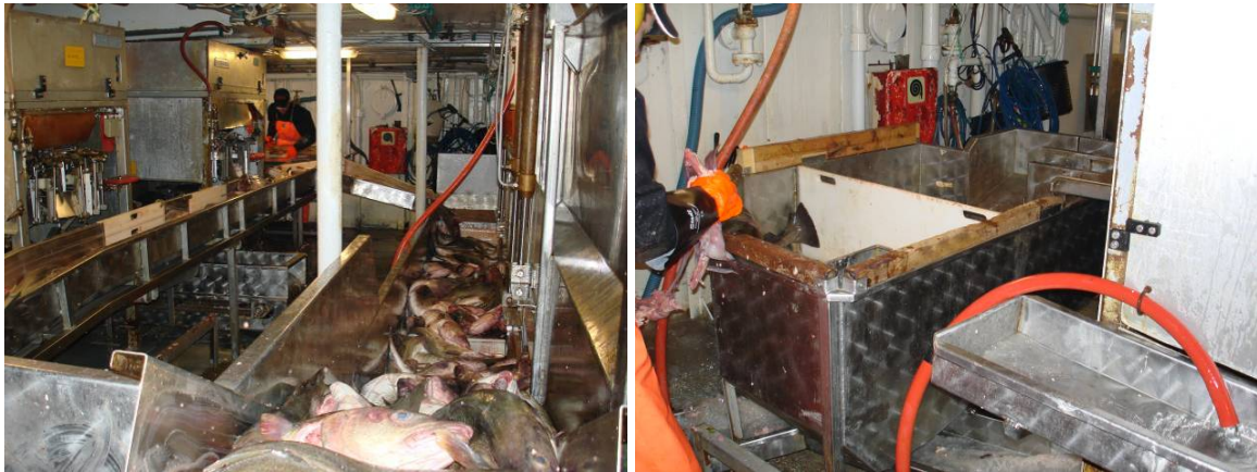
Bilde 3 Fra utblødning til sløyemaskin (venstre) eller manuell sløyning

Fisk som transporteres fra blødebingene til sløyemaskinene kan risikere å gå flere "runder". Det gir stor belastning på fisken da den får tøff behandling i transportbåndene, med mange fall. Her bør man lage en bedre løsning, som gir mer skånsom behandling.